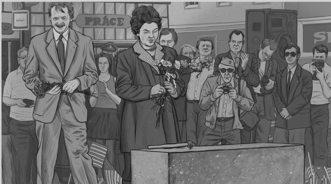
Prezident Václav Havel a velvyslankyně USA na Slavnostech svobody.